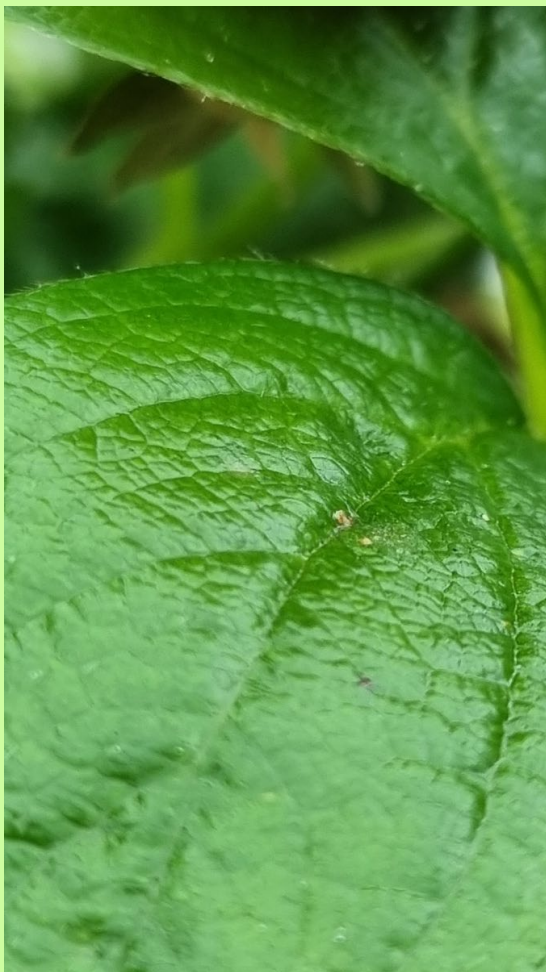
Szamóca növényvédelem kihívások